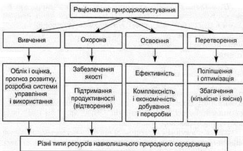
Рис. 2. Головні принципи раціонального природокористування

Раціональне природокористування характеризується загальними принципами, а саме: принципом оптимальності; принципом взаємозалежності суспільства і природи; принципом екологізації виробничої діяльності; принципом збереження просторової цілісності природничих систем, що обумовлено природою різноманіття та обігом речовин у процесі господарчого їх використання; принципом господарського підходу до організації природокористування. Головні принципи раціонального природокористування подано на рис. 2.